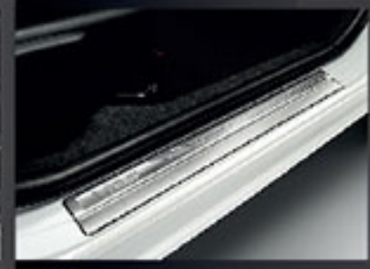
สตัฟเฟิลสแตนเลส Stainless Scuff Plate