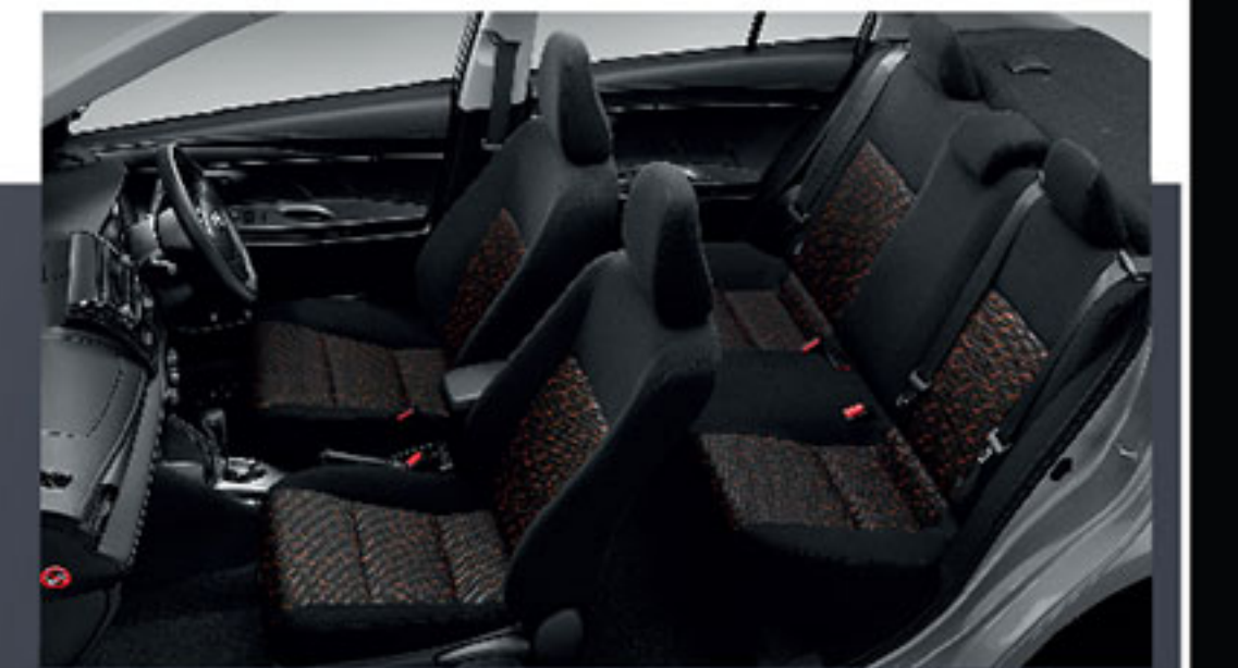
เบาะผ้าสีดำ