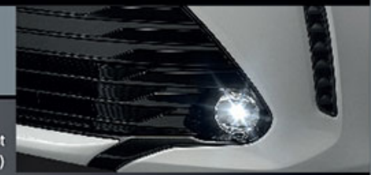
ชุดไฟตัดหมอก แอลอีดี LED Fog Lamp Set (สำหรับรุ่น Mid กระจกหน้าจะเป็นสีทึบดำเท่านั้น)