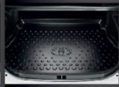
ถาดใส่ของท้ายรถ Luggage Tray