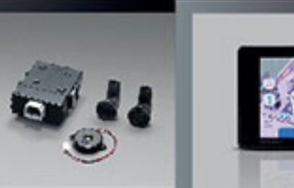
เครื่องเล่นวีซีดีออปติคัลพร้อมระบบนำทาง (หน้าจอ 7 นิ้ว) DVD Infotainment AVN 7"