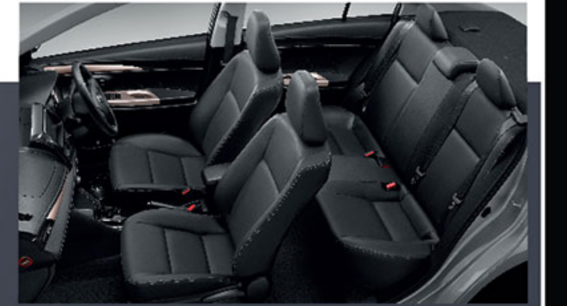
เบาะหนังสีดำ