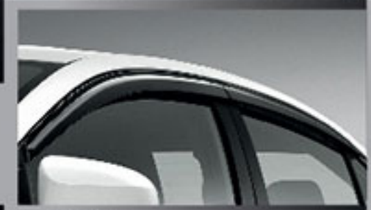
แผงบังแดดข้าง Side Visor