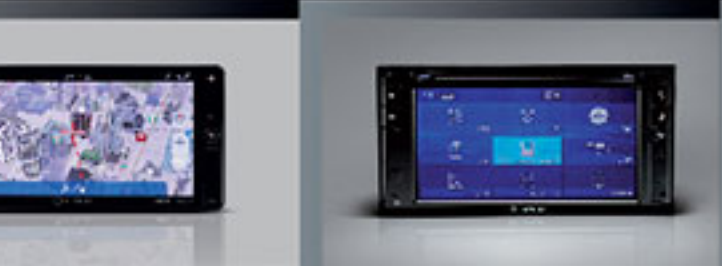
เครื่องเล่นวีซีดีรุ่นมาตรฐาน (หน้าจอ 6.8 นิ้ว) DVD Basic AVX 6.8"