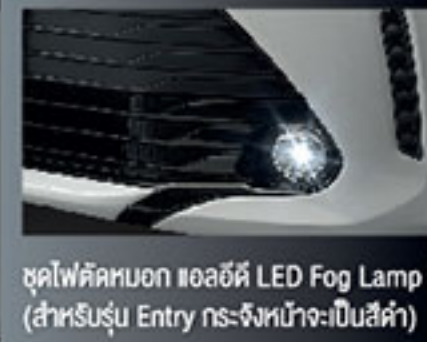
ชุดไฟตัดหมอก แอลอีดี LED Fog Lamp Set (สำหรับรุ่น Entry กระจกหน้าจะเป็นสีใส)