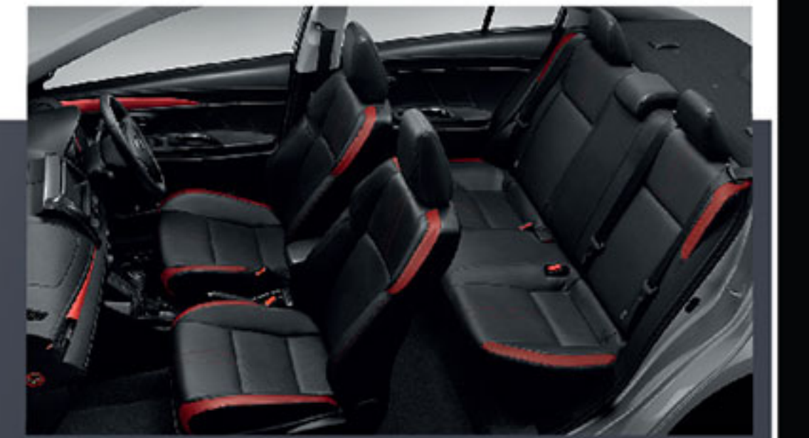
เบาะหนังสีดำ