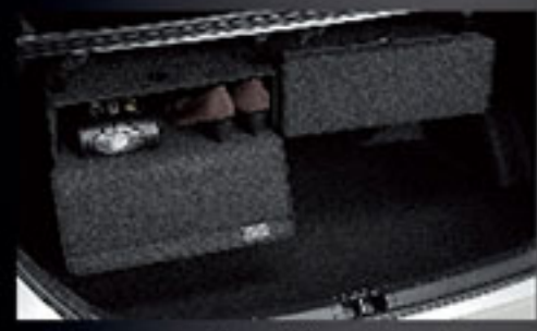
กล่องเขนอเนกประสงค์ท้ายรถ (2 กล่อง) Sky Box (2 Boxes)