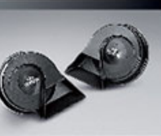
ชุดสัญญาณแตร Premium Horn