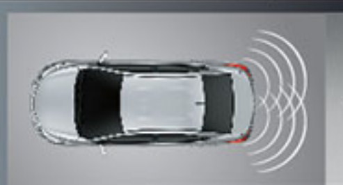
สัญญาณเตือนกระแทกท้ายรถ (สีแดง, สีขาว, สีเงิน, สีเทา, สีดำ, สีน้ำตาล) Back Sensor (Red, Super White, Silver, Gray, Attitude Black, Quartz Brown)