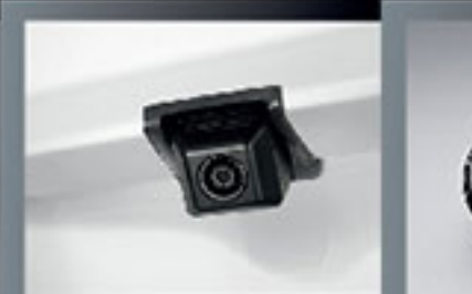
กล้องมองหลัง Back Camera