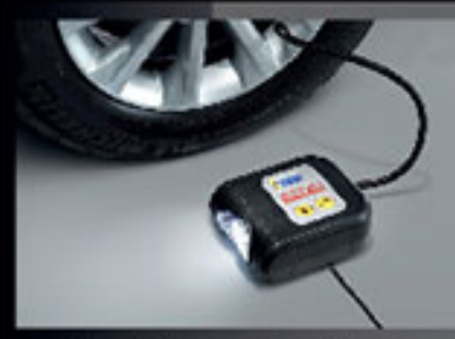
ชุดอุปกรณ์เติมลมยาง (แบบดิจิตอล) 12V Air Compressor (Digital)