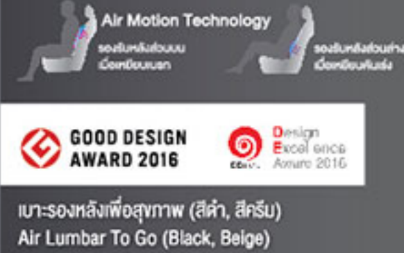
เบาะรองหลังพองสุภาพ (สีดำ, สีครีม) Air Lumbar To Go (Black, Beige)