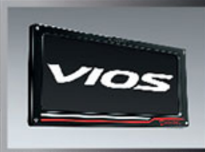
กรอบป้ายทะเบียน (แบบลายโตโยต้า) License Plate Frame (Toyota Styling)