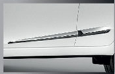
ส่วโครเมียมตกแต่งคันข้าง Side Chrome Moulding