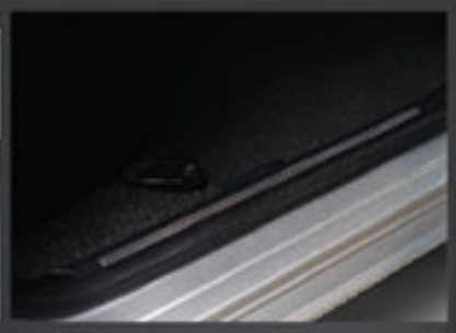
สตัฟเฟิล Scuff Plate